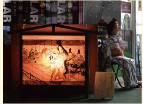
▲ 絵馬提灯 義経千本桜 (個人所蔵) ※写真はお祭りでの様子

絵馬提灯は芝居絵屏風と同じく神社の夏祭りに飾られたもので、箱型の木枠に絵を描いた和紙を貼り、中に入れられたろうそくの光で鑑賞します。神社の境内や参道を彩る灯り取りにもなり、通常は祭りが終わると燃やされる消耗品であり現存している作品はわずかといわれています。連作の絵馬提灯も一部残されており、本展では「義経千本桜」を紹介합니다。