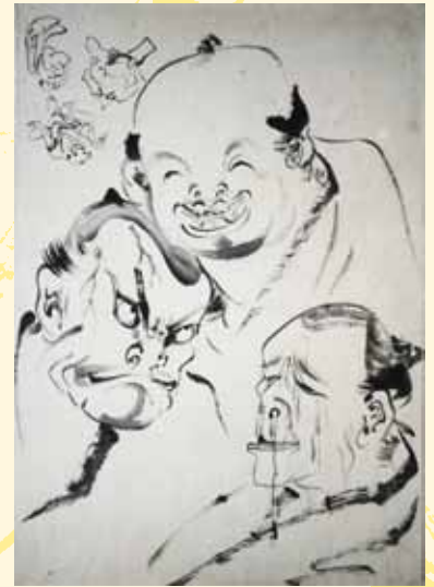
▲ 三人上戸 (個人所蔵)

絵金や弟子が残した白描画 (香南市個人蔵) を展示いたします。人物や芝居絵の下絵など様々な題材で描かれている絵金の白描。力強く美しい墨線からは絵金の画力の高さがうかがえます。