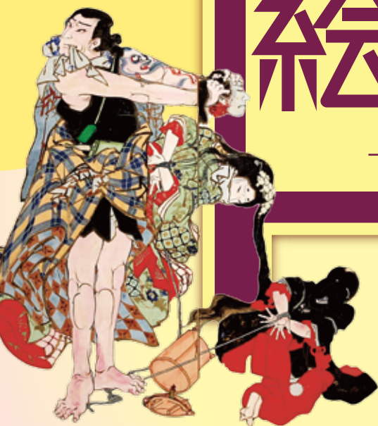
義経千本桜 鮮屋（香南市赤岡町本町四区所蔵） 義経千本桜（個人所蔵）