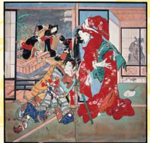
▲ 鎌倉三代記 (赤岡町本町一区所蔵)